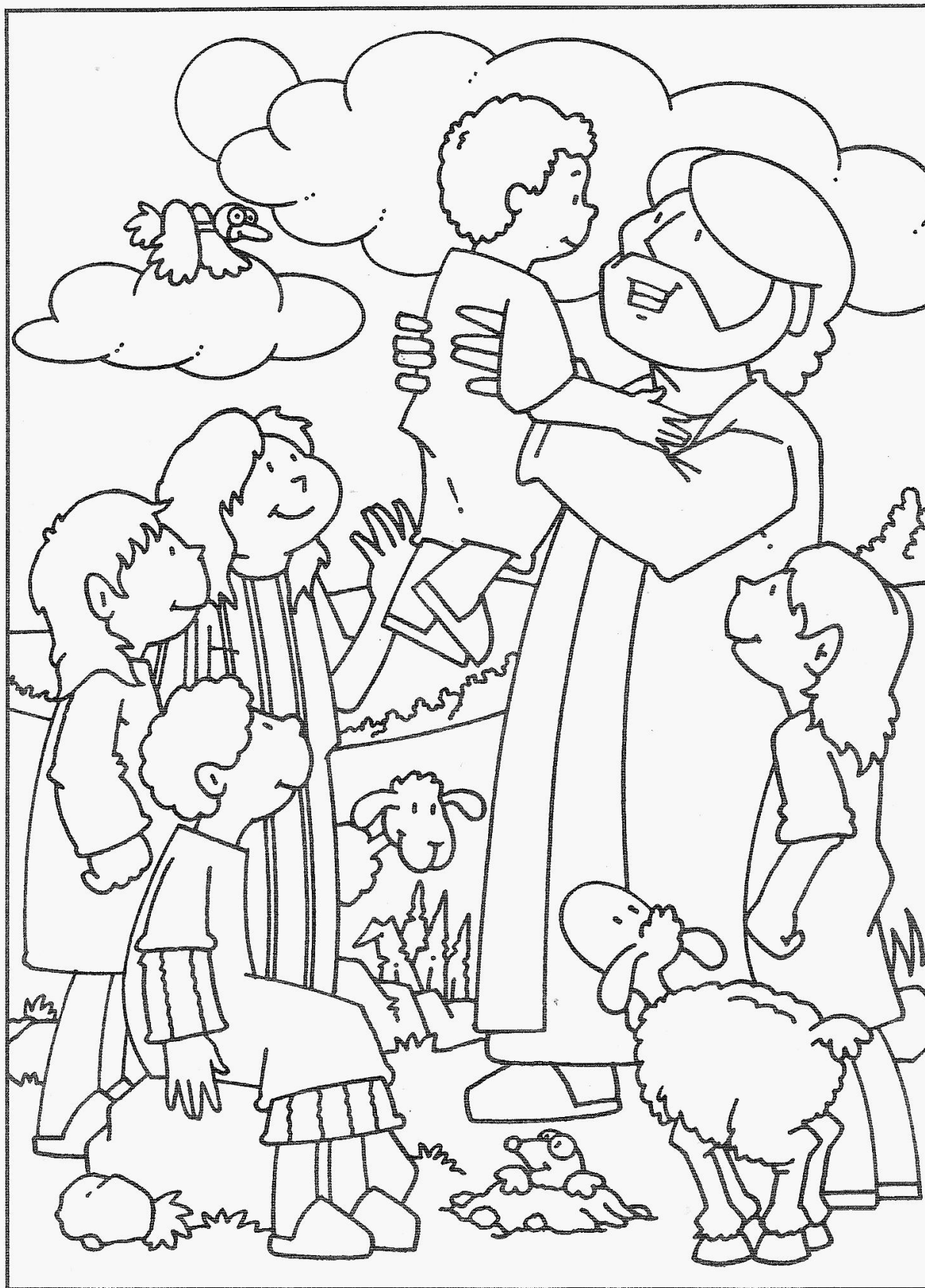
24 Jezus houdt van kinderen Matteüs 19:13-15

Tijdens het startweekend wordt door Hebron een kleurwedstrijd georganiseerd. De kleurplaat vind je hieronder. Lever de kleurplaat in tijdens het startweekend in de kerk, aan de Hebron-stand. Iedereen die de kleurplaat inlevert krijgt een kleine attentie. Je kleurplaat wordt in de winkel tentoongesteld. We hopen dat we heel veel mooie kleurplaten zullen kunnen ophangen!