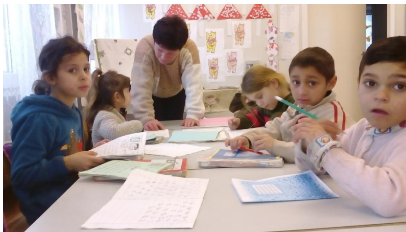
De juf aan het werk in de kleuterklas