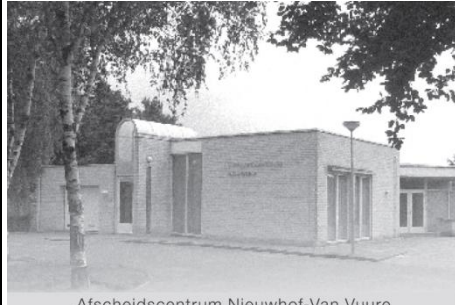
Afscheidscentrum Nieuwhof-Van Vuure Utrechtseweg 110a 1381 GT Weesp

Inlichtingen en opgave bij Wijnand van Bodegraven, tel. 0294 251 841