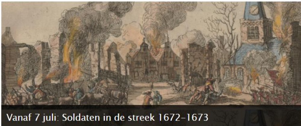
Vanaf 7 juli: Soldaten in de streek 1672-1673

Zij schrijven daarbij dat zij voor deze tentoonstelling dankbaar geput hebben uit de archieven in hun beheer. Ook uit het archief van de Weesper kerken zijn stukken voor de tentoonstelling geselecteerd, die het verhaal van het Rampjaar in onze streek vertellen.