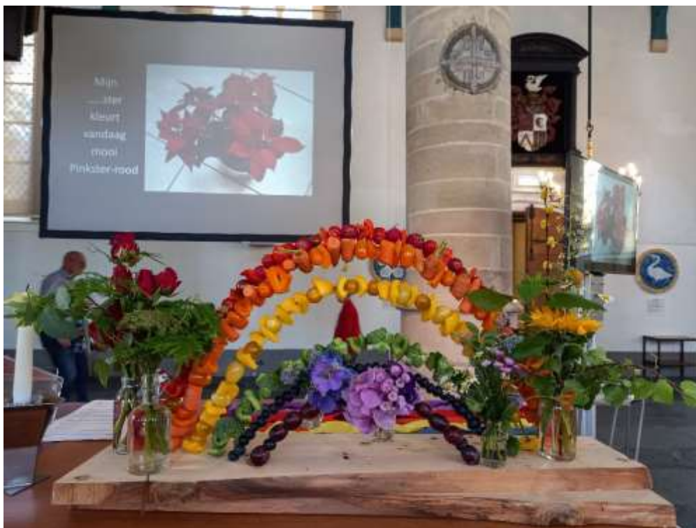
De regenboog schikking op de liturgische tafel op eerste Pinksterdag, gemaakt door Annelies Westra.