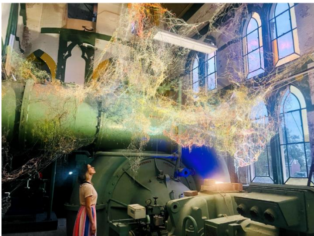
Kairos tijdens Open Monumentendag Leiden 2023

KAIROS LUX_ÆTERNA wordt een multimedia installatie in de Grote of Laurenskerk in Weesp, een sculptuur van draad, draad en verf zal in het koor van de kerk komen te hangen. Geluid, video en lichtontwerp worden op maat gemaakt voor ons gebouw. KAIROS is geïnspireerd op het christelijke labirynth, symbool voor de menselijke levensweg. Het leven kronkelt en heeft bochten. Zo ook in deze installatie. Waar raken het heilige en menselijke elkaar? Wat ontstaat er als dat gebeurt?